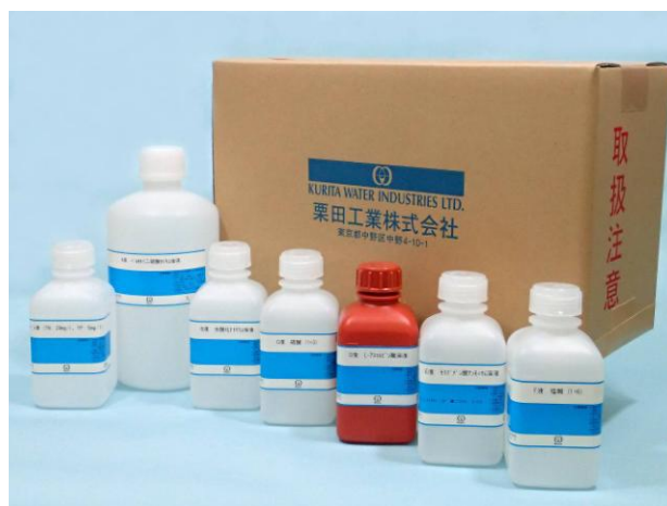
窒素・りん現場計器用 標準液試薬

全窒素・全りん測定装置や COD 自動測定装置などの環境分析機器に使用する試薬から、日本工業規格や上水試験方法に規定された試薬まで幅広く、きめ細やかな調製・販売を行っております。また、高速液体クロマトグラフ用の充填剤やカラムなどの製品の販売も行っております。